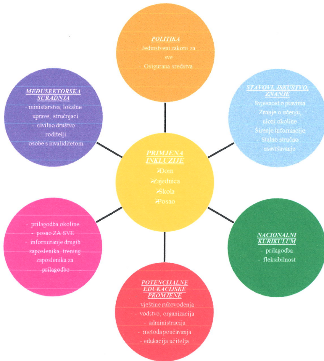
Slika 1. Primjena inkluzije

(Skjortsen, 2001. prema Igrić, Lj. i sur. (2015). Osnove edukacijskog uključivanja: Škola po mjeri svakog djeteta je moguća . Zagreb: Školska knjiga.)